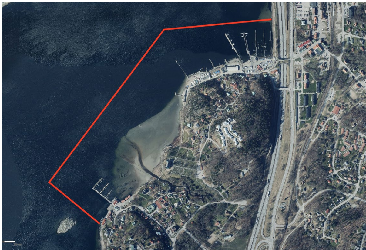
Gästhamnen Källviken (Skafföbron), Uddevalla